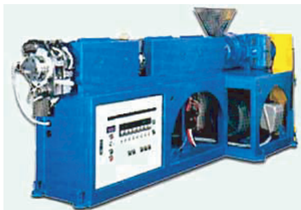
ベント式 65mm L/D