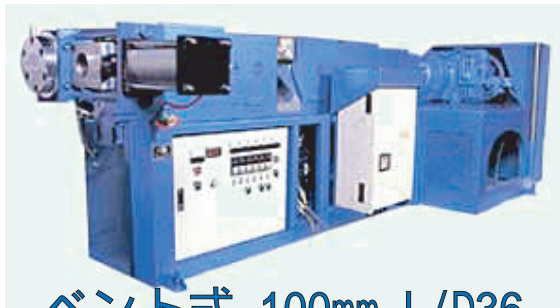
ベント式 100mm L/D36